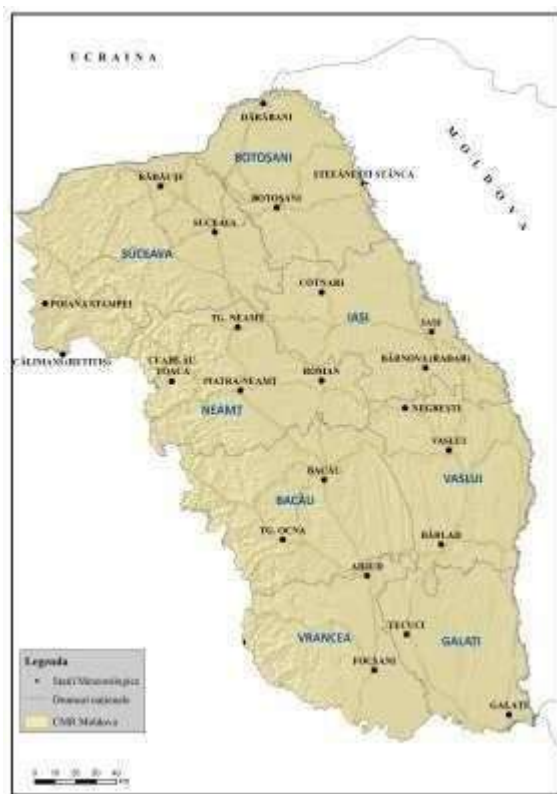
Centrul Meteorologic Regional Moldova

Stațiile meteorologice administrate de C.M.R. Moldova sunt încadrate în județele: Vrancea, Galați, Bacău, Vaslui, Neamț, Iași, Suceava, Botoșani.