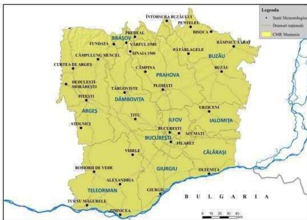
Centrul Meteorologic Regional Muntenia

Stațiile meteorologice administrate de C.M.R. Muntenia sunt încadrate în județele: Ilfov, Giurgiu, Teleorman, Argeș, Dâmbovița, Prahova, Călărași, Covasna, Ialomița, Buzău, Brașov și Municipiul București.