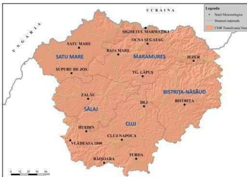
Centrul Meteorologic Regional Transilvania Nord

Stațiile meteorologice administrate de C.M.R. Transilvania Nord sunt încadrate în județele: Cluj, Sălaj, Satu Mare, Maramureș, Bistrița-Năsăud.