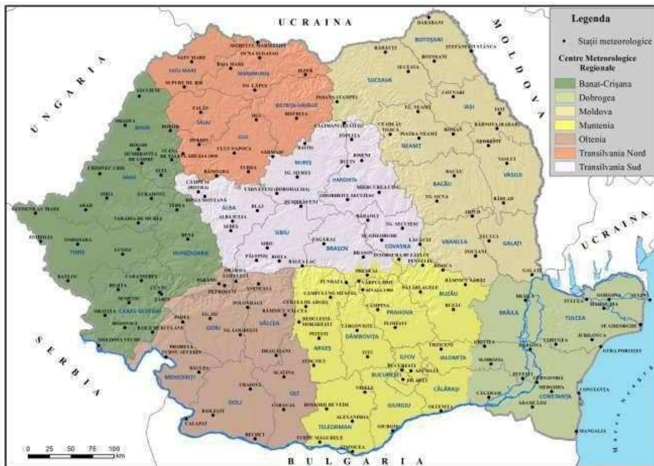
Rețeaua națională de stații meteorologice

Cele 7 Centre Meteorologice Regionale (CMR) sunt conform legii, unități fără personalitate juridică și sunt organizate după principiul omogenității climatice a teritoriului României, în conformitate cu recomandările internaționale în domeniu. Acestea asigură realizarea obiectului de activitate al Administrației Naționale de Meteorologie la nivel regional și local.