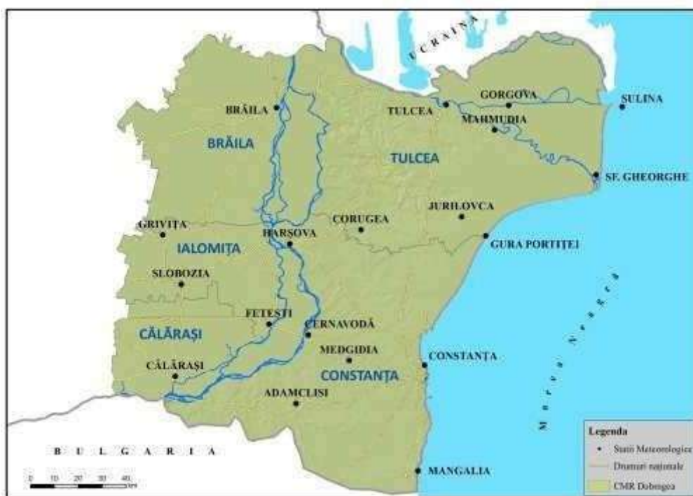
Centrul Meteorologic Regional Dobrogea

Stațiile meteorologice administrate de C.M.R. Dobrogea sunt încadrate în județele: Constanța, Tulcea, Brăila, Calarași, Ialomița.