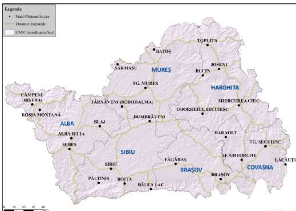
Centrul Meteorologic Regional Transilvania Sud

Stațiile meteorologice administrate de C.M.R. Transilvania Sud sunt încadrate în județele: Sibiu, Brașov, Alba, Mureș, Covasna, Harghita.