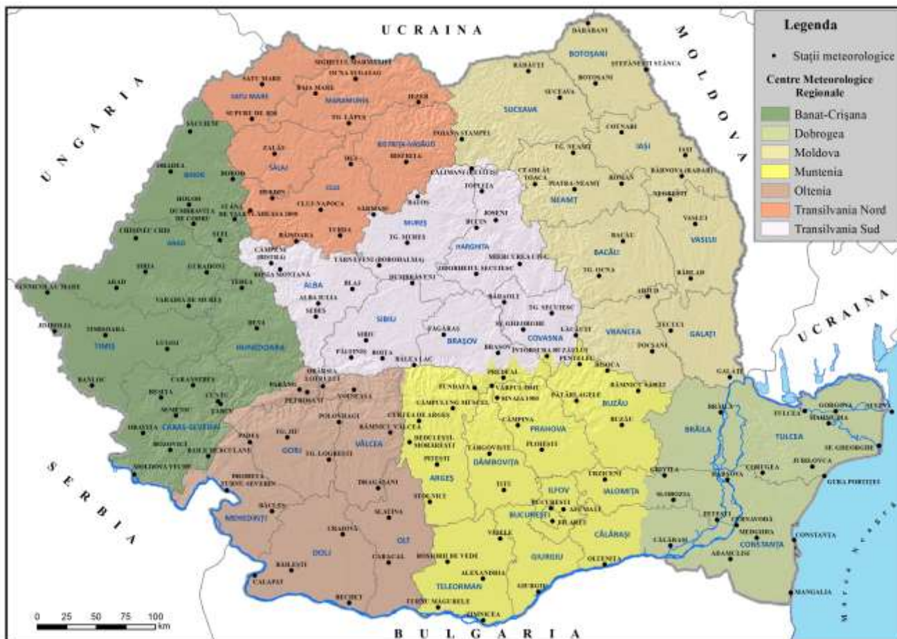
Rețeaua națională de stații meteorologice

Cele 7 Centre Meteorologice Regionale (CMR) sunt conform legii, unități fără personalitate juridică și sunt organizate după principiul omogenității climatice a teritoriului României, în conformitate cu recomandările internaționale în domeniu. Acestea asigură realizarea obiectului de activitate al Administrației Naționale de Meteorologie la nivel regional și local.