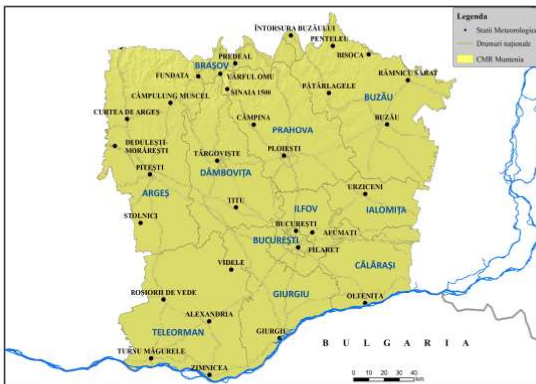
Centrul Meteorologic Regional Muntenia

Stațiile meteorologice administrate de C.M.R. Muntenia sunt încadrate în județele: Ilfov, Giurgiu, Teleorman, Argeș, Dâmbovița, Prahova, Călărași, Covasna, Ialomița, Buzău, Brașov și Municipiul București.