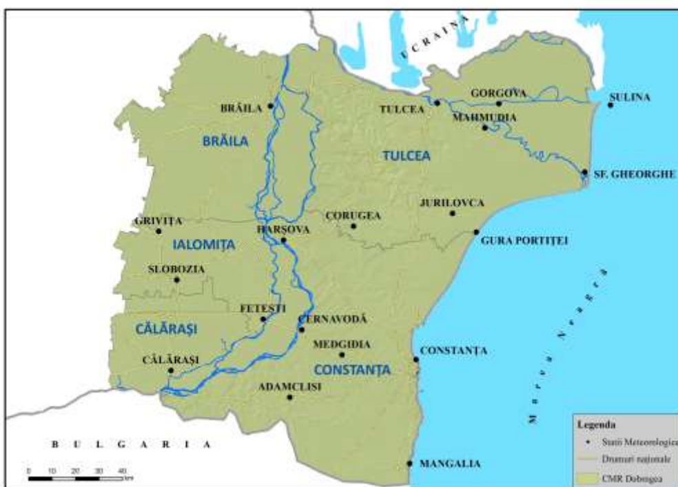
Centrul Meteorologic Regional Dobrogea

Stațiile meteorologice administrate de C.M.R. Dobrogea sunt încadrate în județele: Constanța, Tulcea, Brăila, Calarași, Ialomița.