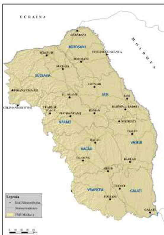
Centrul Meteorologic Regional Moldova

Stațiile meteorologice administrate de C.M.R. Moldova sunt încadrate în județele: Vrancea, Galați, Bacău, Vaslui, Neamț, Iași, Suceava, Botoșani.